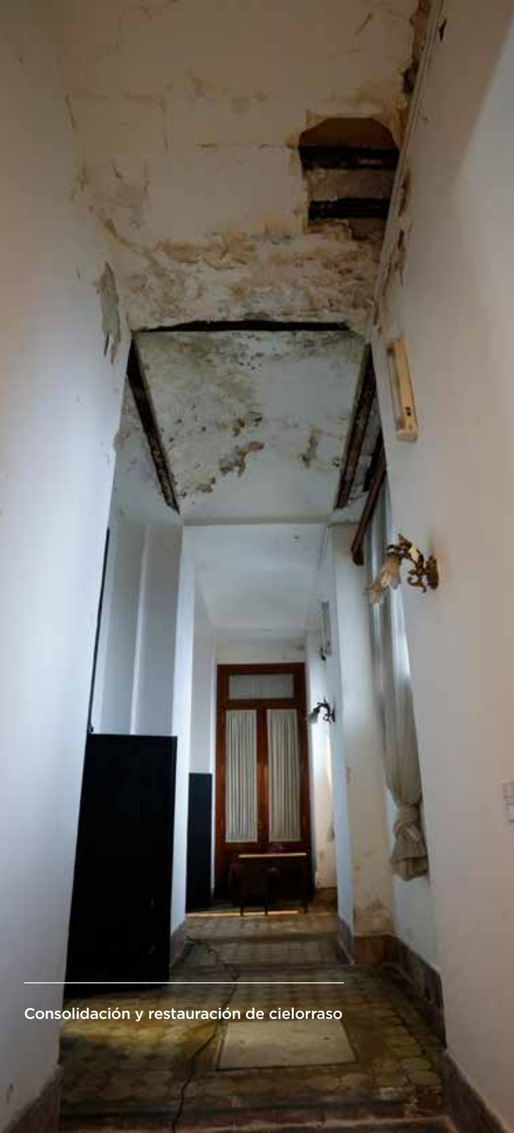
Consolidación y restauración de cielorraso