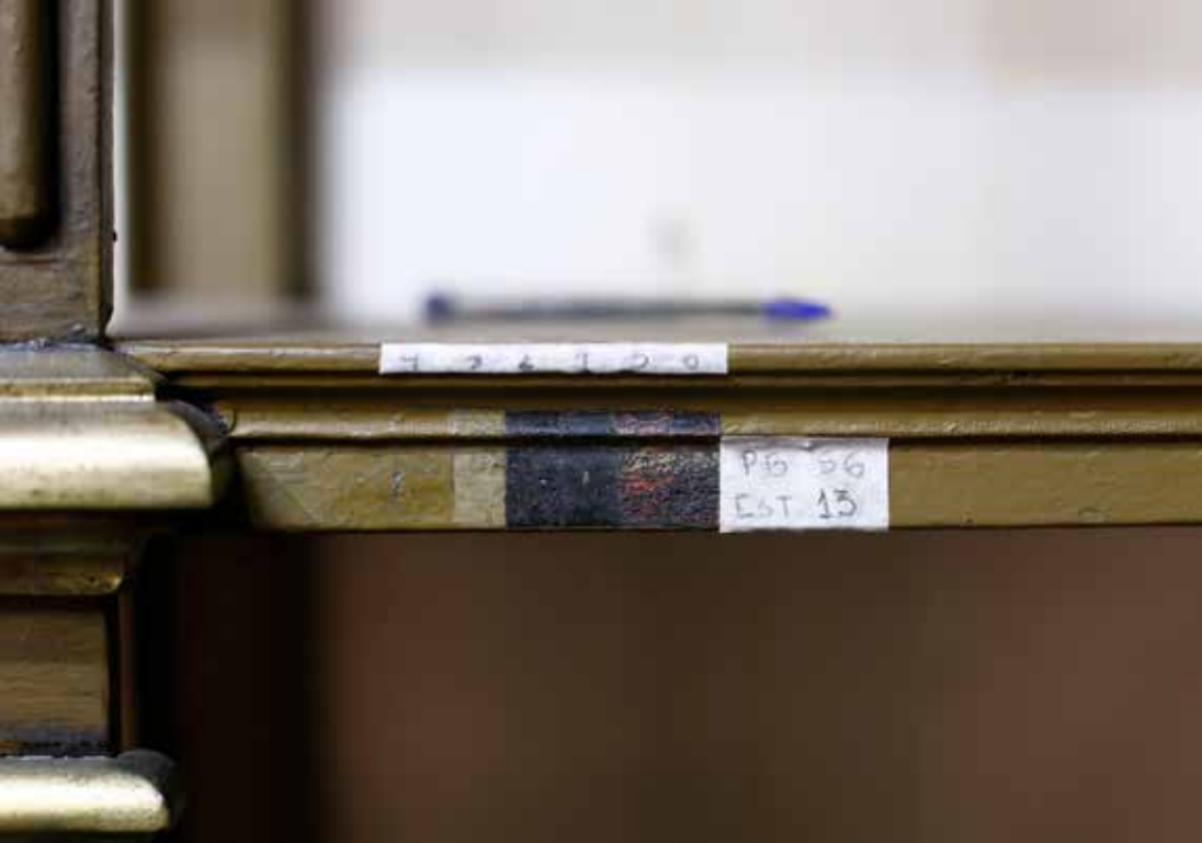
Estratigrafías en estantería de metal