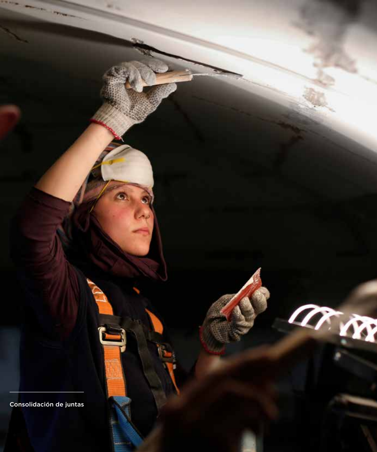
Consolidación de juntas