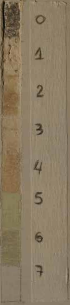
Resultado de las estratigrafías