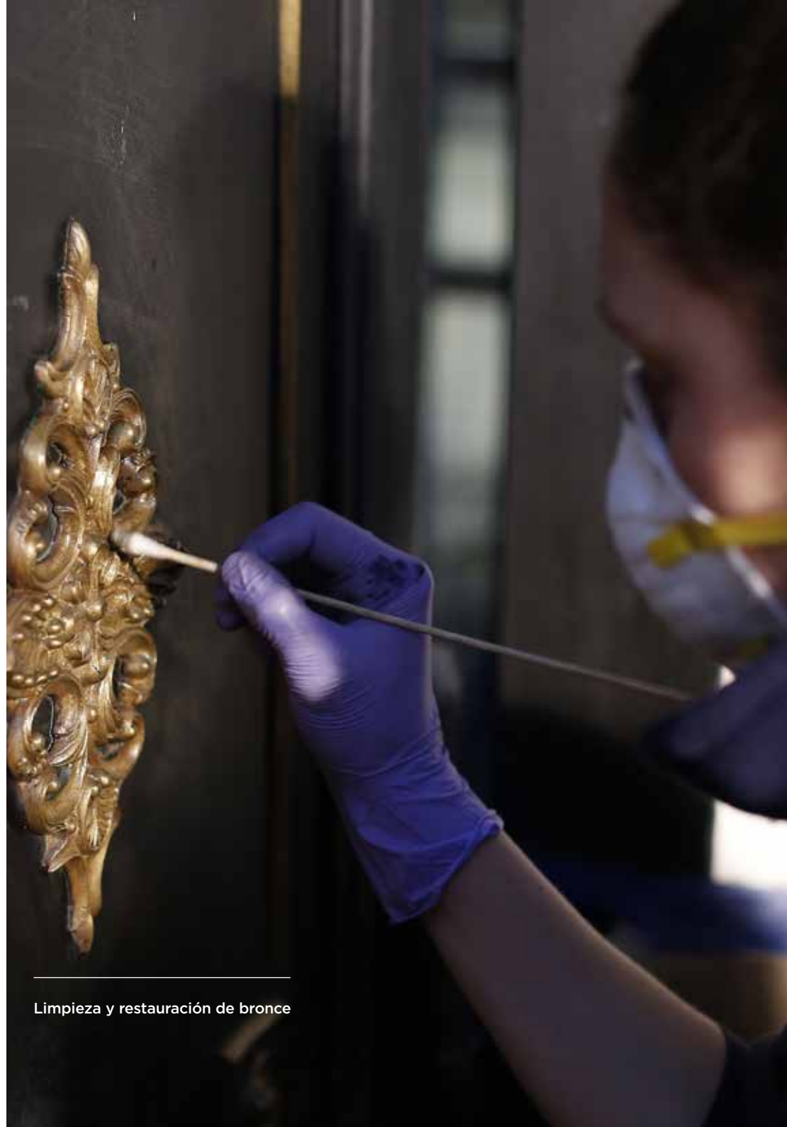
Limpieza y restauración de bronce