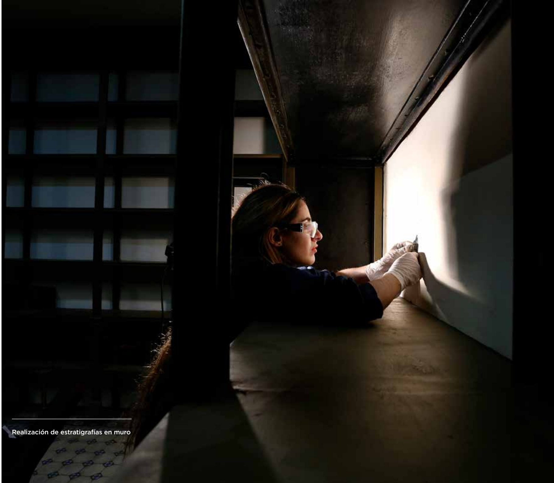
Realización de estratigrafías en muro