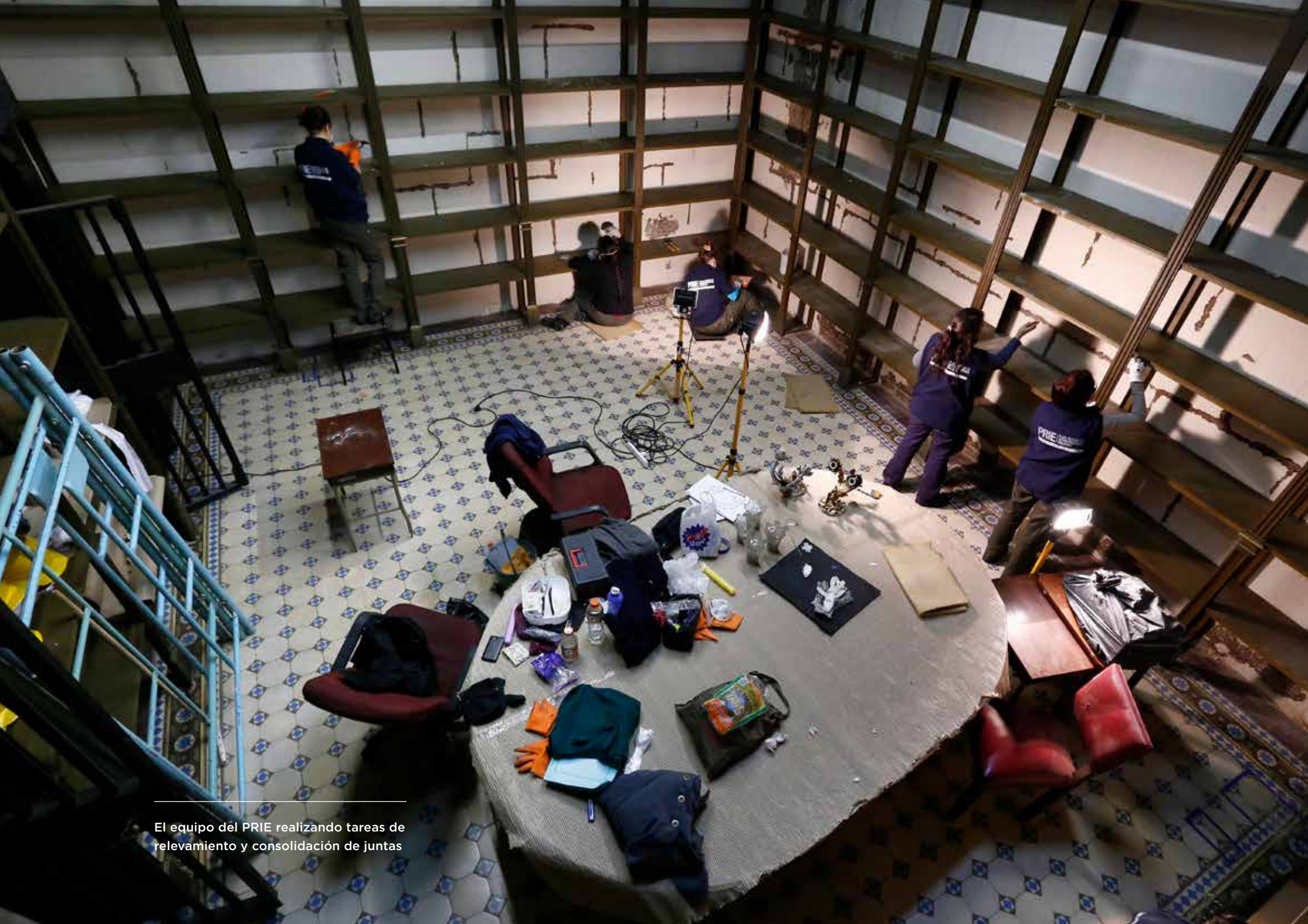
El equipo del PRIE realizando tareas de relevamiento y consolidación de juntas