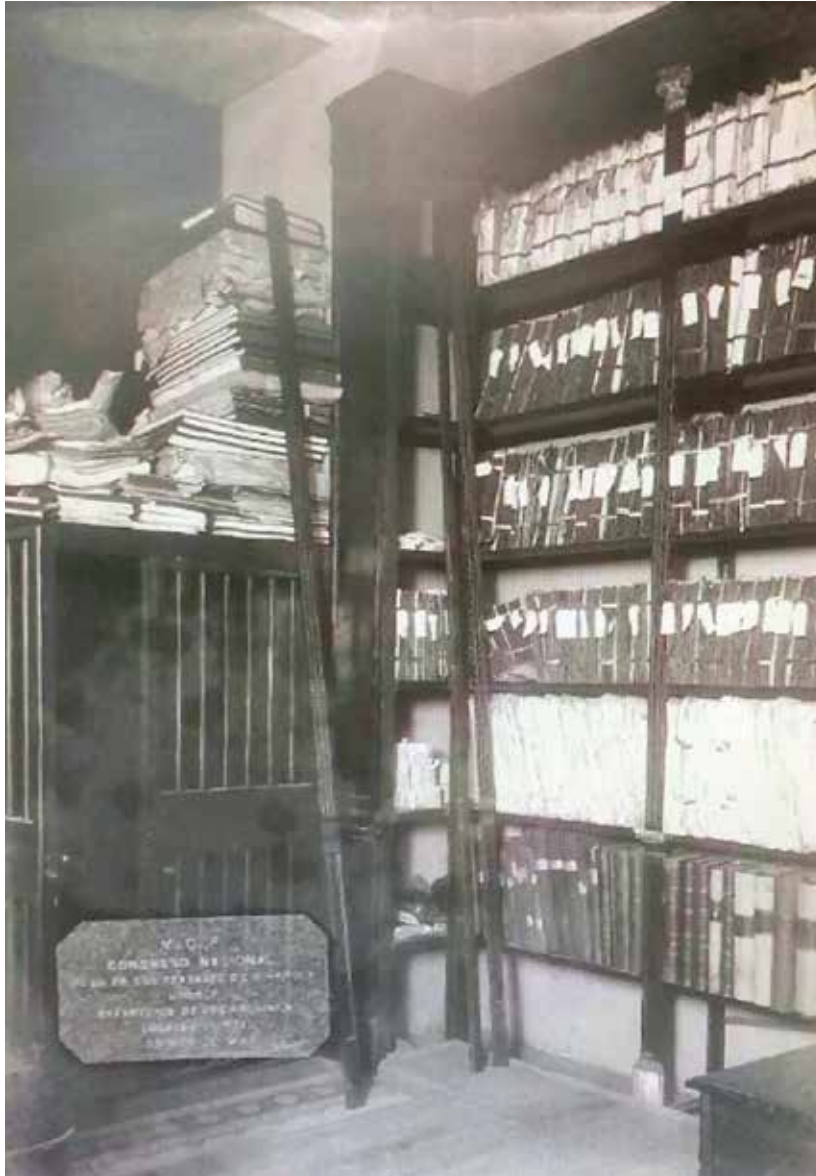
Foto histórica de la Bóveda Centro de Documentación e Información de la Administración Pública