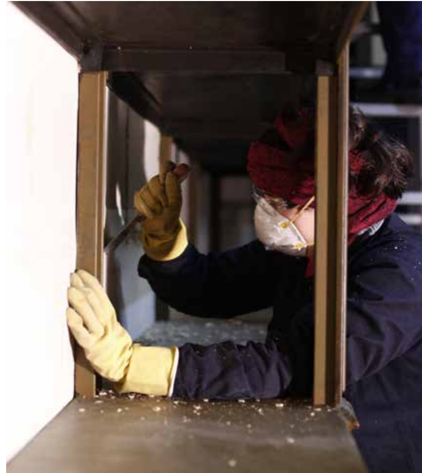
Remoción de sustratos desprendidos

El sector fue rehabilitado para uso administrativo equipándolo con el mobiliario y las tecnologías necesarias, prevaleciendo una respetuosa resolución técnica sin afectar el patrimonio edilicio.