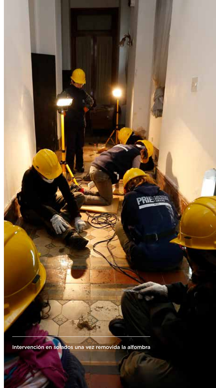
Intervención en solados una vez removida la alfombra